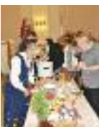
17-mai feiring med gøy, alvor, mat og kaffe.